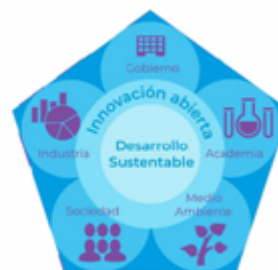
Figura 1. Modelo Pentahélice

Asimismo, con base en el desarrollo tecnológico promovido con este modelo, se apoyará la generación de cadenas de valor industrial considerando los ciclos de vida completa de los productos y soluciones tecnológicas, desde su extracción y procesamiento de materias primas, el procesamiento-construcción, instalación y mantenimiento, hasta su reciclado. Se privilegiará la formación de cadenas de valor con alto contenido nacional. En prospectiva se contempla la incorporación creciente de maestros y doctores como líderes de ciencia y tecnología dentro del sector productivo nacional, así como la generación de empresas de base tecnológica creadas por científicos y enfocadas en maximizar el uso eficiente del conocimiento creado o desarrollado en México, con beneficio social y productivo, orientadas siempre al bienestar y la sustentabilidad.