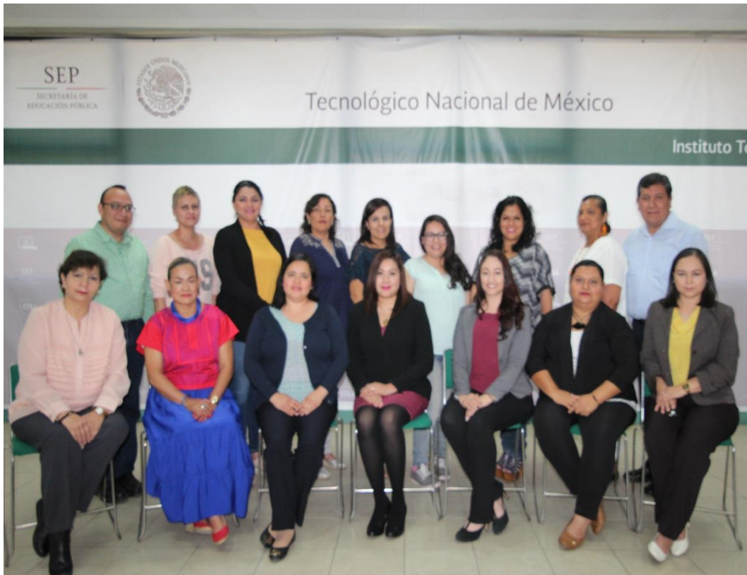
Figura 1. Grupo de trabajo de la revisión y actualización PNT TecNM

Como parte de una estrategia académica, en febrero y mayo del 2018, la Dirección de Docencia e Innovación Educativa a través del Área de Desarrollo Académico, reúne a un grupo de representantes de 13 Institutos tecnológicos adscritos al TecNM para contribuir al Programa Institucional de innovación y desarrollo 2013-2018 en la revisión y actualización del Plan de Tutorías Vigente del TecNM.