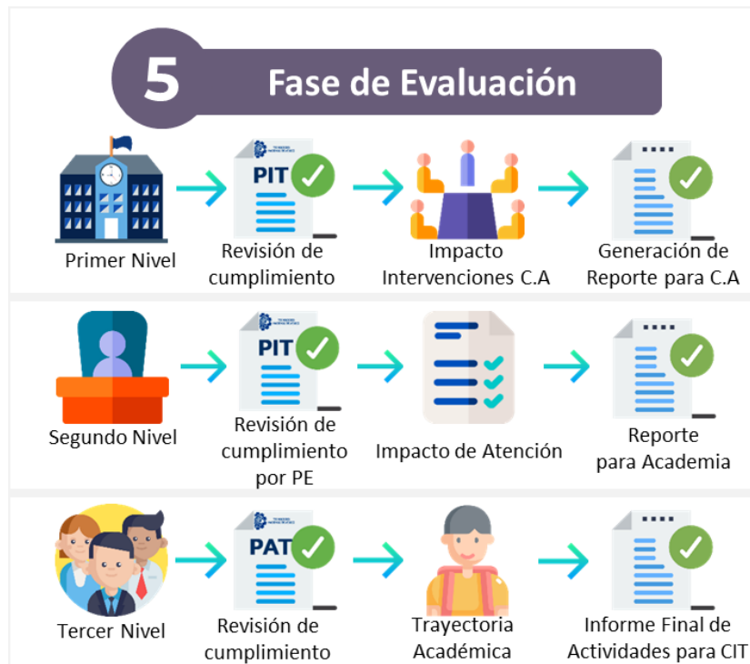
Figura 6. Fase de Evaluación del Proceso de Tutorías. Elaboración Propia.